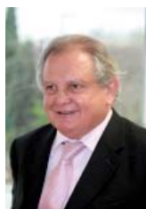
Jean-Yves Le Déaut